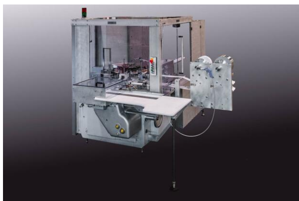
RU universal wrapping machine; on picture set up for tablet wrapping with paper banding

Today, Rasch have about 65 employees and trainees in their own facilities in Cologne. Amongst wrappers for hollow figures, the range of products consists of various universal and specialized machines. Emphasis is not only given to the individual machine, but to entire packaging plants with diverse feeding and conveying systems. Still, tempering machines, pumps and valves are an important part of the product line. The extensive service covers maintenance and repair as well as overhauls and automatization.