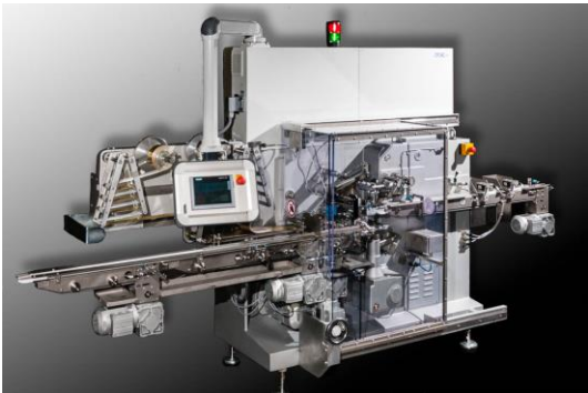
Rasch special wrapping machine type RKS 2