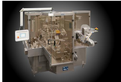
Rasch special wrapping machine type FI 4-6 for hollow figures